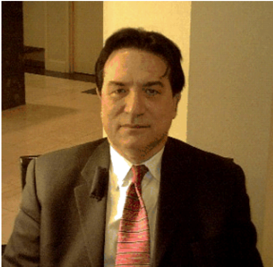
Alfred Lambremont Webre

Alfred Lambremont Webre, ki se je izšolal za odvetnika na Yale-u, je postal vesoljski aktivist. Napisal je knjigo o "Exopolitiki" – nauku o odnosu med ljudmi in ne zemljani. Njegova spletna stran exopolitics.com je "obvezna" za vsakogar, ki se ukvarja z omenjeno temo. Na tej strani poroča Webre o aktualnem razvoju Exopolitike, ki postavlja iluzionaren teater konvencionalne politike v čisto senco.